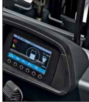
Pantalla a color