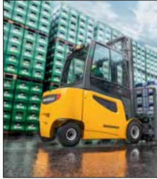
Un recorrido suave incluso en aplicaciones en exteriores