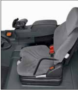
Compartimiento ergonómico del operador