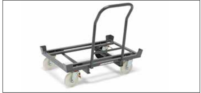
Barra de agarradera opcional para incremento de altura