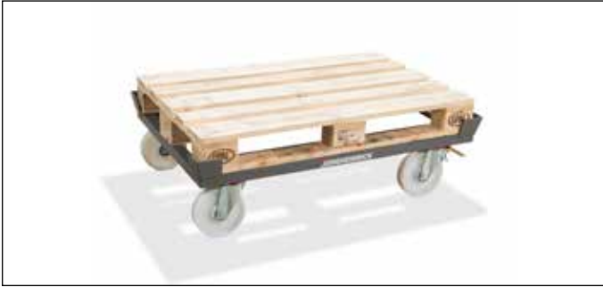
Disponibile en varios tamaños y capacidades de carga